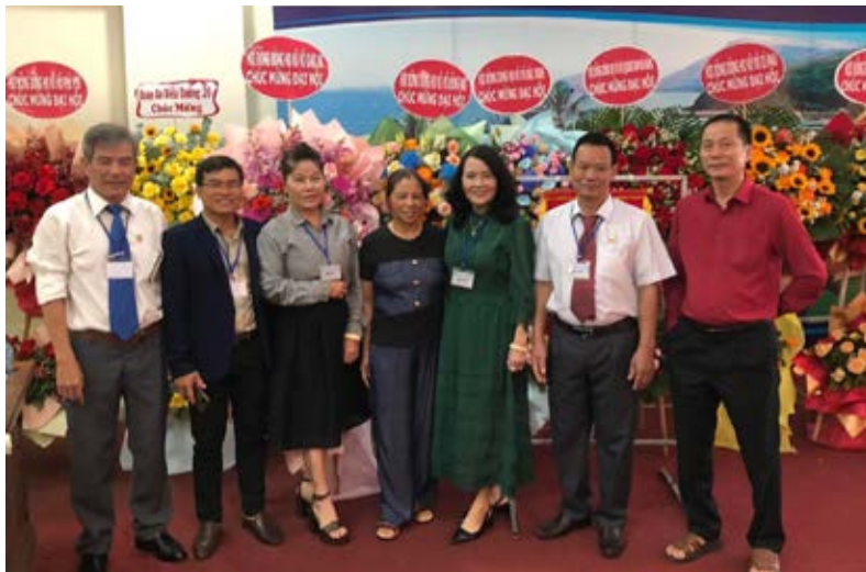
Đoàn đại biểu HDDH Vũ - Võ tỉnh Đắk Lắk dự Đại hội dòng họ tỉnh bạn

Dù mới thành lập được hơn 6 năm nhưng HDDH Vũ - Võ tỉnh Đắk Lắk đã tổ chức nhiều hoạt động thiết thực, có ý nghĩa, cùng nhau đoàn kết, quyết tâm hoàn thành xuất sắc các nhiệm vụ, mục tiêu, kế hoạch của Đại hội đại biểu dòng họ Vũ - Võ tỉnh Đắk Lắk lần thứ nhất đã đề ra. HDDH Vũ - Võ tỉnh Đắk Lắk cũng đang tích cực chuẩn bị cho Hội nghị tổng kết, triển khai phương hướng hoạt động cho năm 2024 vào dịp tổng kết cuối năm.