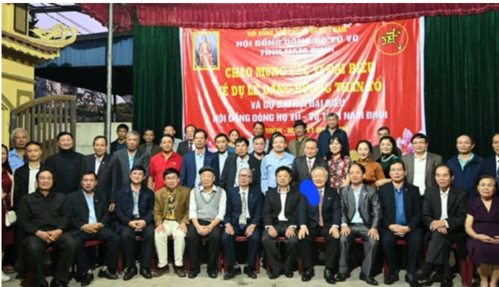
Các đại biểu chụp ảnh kỷ niệm với lãnh đạo HDDH Vũ - Võ tỉnh Nam Định