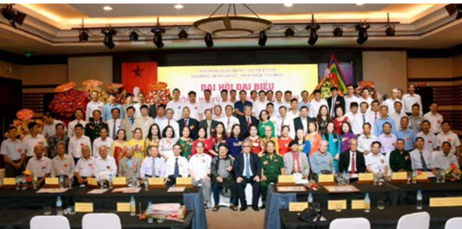
Các đại biểu chụp ảnh kỷ niệm với lãnh đạo dòng họ Vũ - Võ Việt Nam