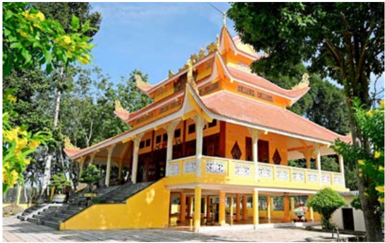
Công trình nhà thờ họ Vũ - Võ tỉnh Bình Dương (TP. Tân Uyên) hoàn thành giai đoạn 2

Năm 2024, cùng với công tác tuyên truyền về truyền thống dòng họ, qua đó vận động, tập hợp tổ chức và thành lập BCH hội đồng dòng họ ở các huyện, thị, thành phố trong tỉnh, HĐDH Vũ - Võ tỉnh Bình Dương tiếp tục vận động các thành viên BCH, BTV, các mạnh thường quân, các tổ chức và cá nhân có tâm huyết với dòng họ đóng góp Quỹ Khuyến học khuyến tài, và quỹ hoạt động của dòng họ để có thêm