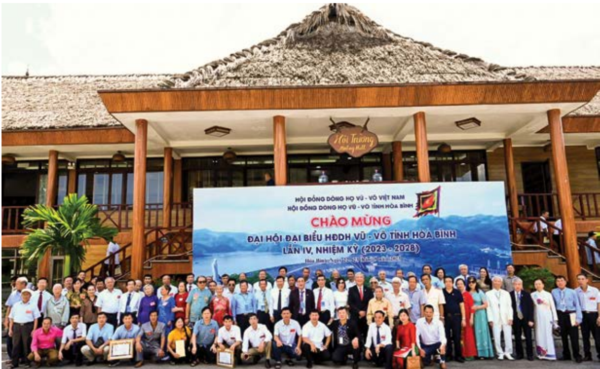
Lãnh đạo HDDH Vũ - Võ Việt Nam và các tỉnh thành chụp ảnh kỷ niệm với các đại biểu dự Đại hội