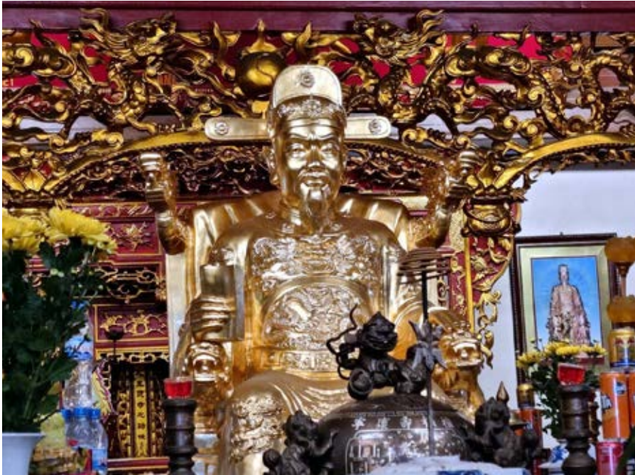
Tượng Tiên sĩ Vũ Phi Hồ nặng 5,2 tạ bằng đồng nguyên chất dát vàng mười

là dân ngụ cư lại mẹ góa con cô nghèo khổ... Tiên sĩ Vũ Phi Hồ từng phần chí rời cổ hương, trút bỏ bút nghiên, ném hòn đá xuống sông Yên Lập và thề rằng: “Khi nào hòn đá nổi thì đất Hoàn Bò mới có người tài”. Khi cụ Vũ Phi Hồ qua đời, triều đình xét công trạng, ban thưởng mỹ tự và sức cho Tri huyện Hoàn Bò xây dựng đền thờ, cấp hương hỏa, định lễ xuân thu nhị kỳ.