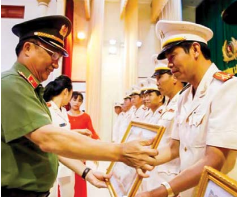
Thượng tướng Nguyễn Văn Thành tặng Bằng khen cho 26 đồng chí nguyên là lãnh đạo Công an các đơn vị, địa phương được tặng Huân chương Bảo vệ Tổ quốc hạng Ba

lập chính sách đô thị, Manila (2011); Các giải pháp về sự tương phản của môi trường trong Hội nghị chuyên đề những người thực hiện ứng dụng tại Đại học, Jerusalem, Israel (2011).