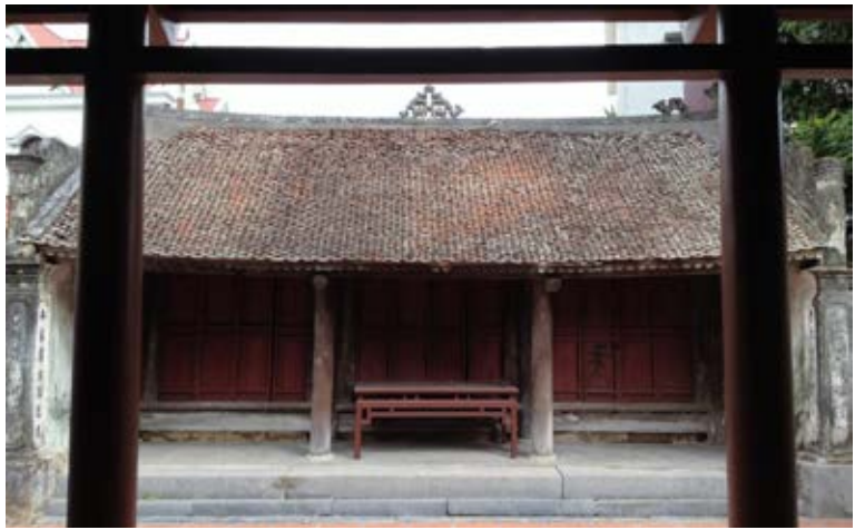
Từ đường trên 200 năm của dòng họ Vũ - Võ xã Tân Việt

HDDH Vũ - Võ huyện Thanh Hà từ khi được thành lập, đã trải qua 2 kỳ Đại hội, được sự quan tâm chỉ đạo của