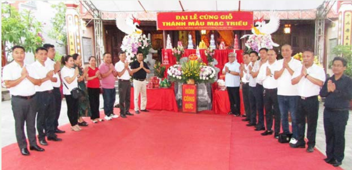
Đại diện lãnh đạo HDDH Vũ - Võ Việt Nam và các đại biểu dâng hương tại đền Thánh Mẫu Mạc triều Vũ Thị Ngọc Toàn