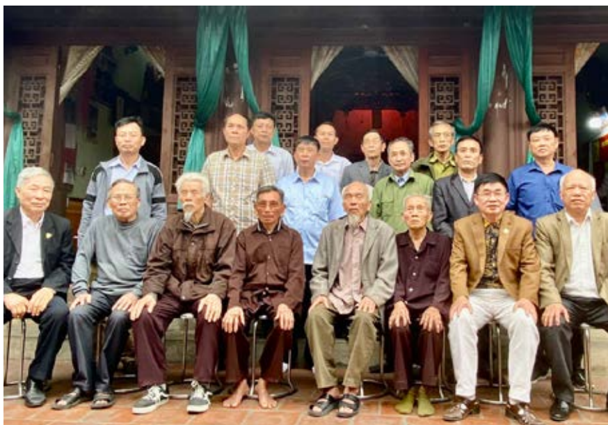
Lãnh đạo HĐDH Vũ - Võ tỉnh Bắc Ninh và huyện Yên Phong chụp ảnh kỷ niệm với các cụ cao niên