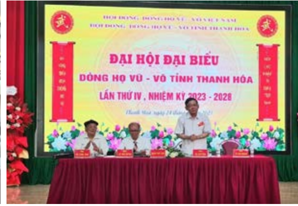
Quang cảnh Đại hội

Đến nay Bộ Văn hóa, Thể thao và Du lịch cấp hai bằng Di tích lịch sử Văn hóa cấp Quốc gia và nhiều di tích được UBND tỉnh cấp bằng Di tích lịch sử cấp tỉnh. Thường trực HỖĐH Vũ - Võ tỉnh đã tham dự hầu hết các cuộc họp họ ở các huyện, và xuống tận các làng xã, xóm thôn dự các sự kiện trọng đại ở các chi họ. HỖĐH tỉnh đã làm tốt công tác thi đua khen thưởng, khuyến học, khuyến tài theo đúng quy định, hướng dẫn của Ban Thi đua Khen thưởng Trung ương.