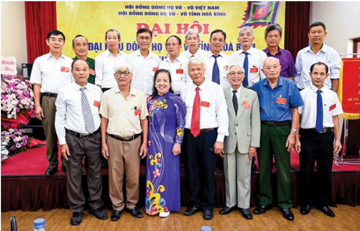
Ban Chấp hành dòng họ Vũ - Võ tỉnh Hòa Bình, nhiệm kỳ 2023-2028