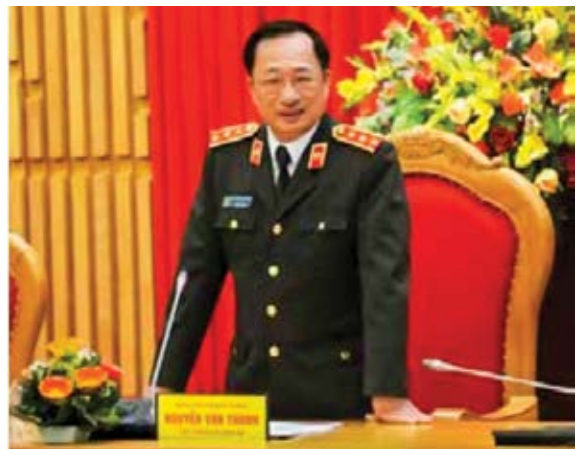
Thượng tướng, PGS. TS Nguyễn Văn Thành phát biểu tại buổi gặp mặt Tuổi trẻ CAND dự Đại hội Đoàn toàn quốc

Với niềm đam mê học tập nâng cao trình độ, mở rộng kiến thức, với tư duy, “Giáo dục là mảnh đất màu mỡ vun trồng trí thức” và “Kiên trì học tập suốt đời”, trong quá trình công tác và học tập ông đã