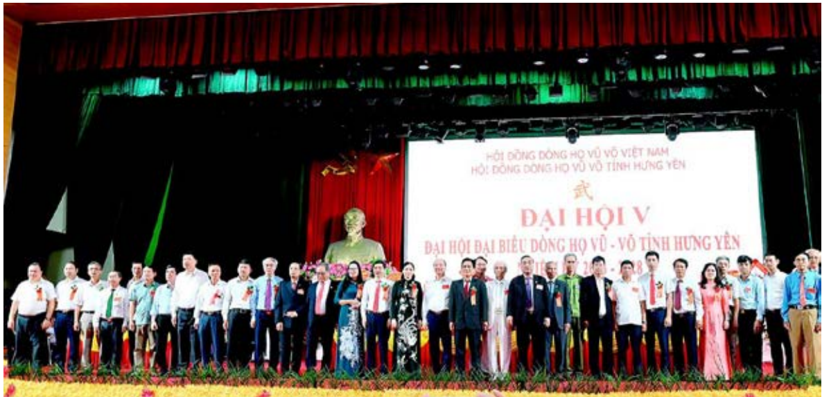
Ban Chấp hành HDDH Vũ - Võ tỉnh Hưng Yên nhiệm kỳ 2023 - 2028

N gày 24/09/2023 tại Trung tâm Thông tin - Hội nghị tỉnh Hưng Yên, đại hội đại biểu dòng họ Vũ - Võ tỉnh Hưng Yên lần thứ V, nhiệm kỳ 2023 - 2028 long trọng khai mạc.