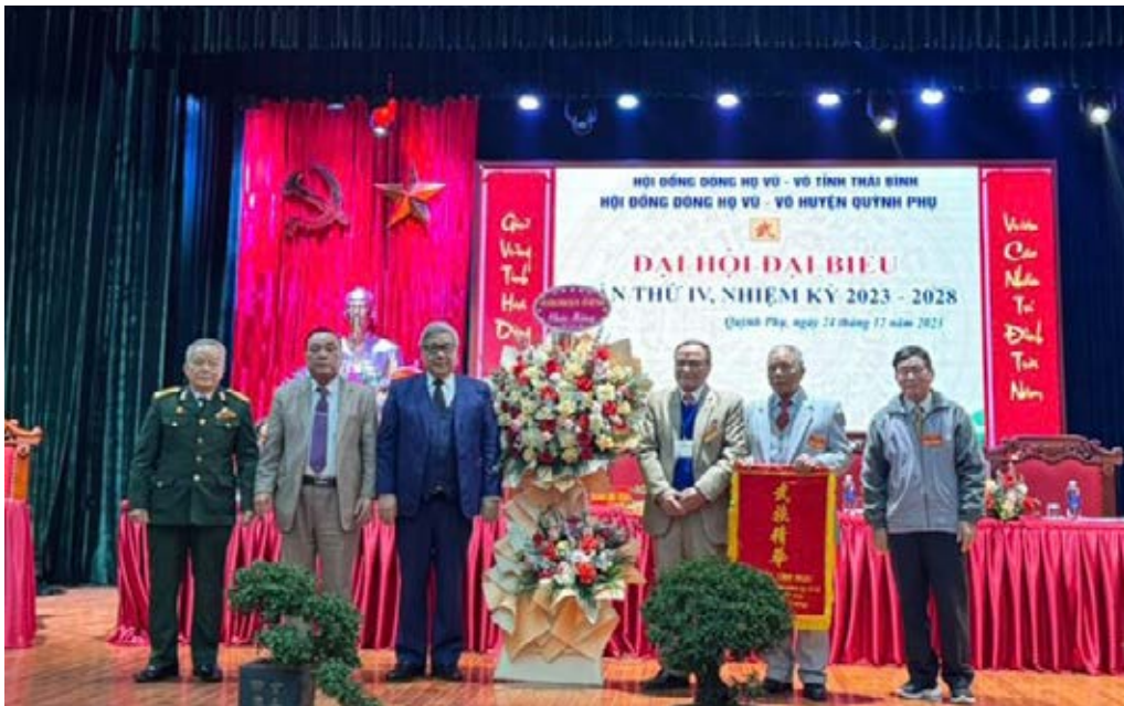
Lãnh đạo HDDH Vũ - Võ Việt Nam tặng hoa và bức trướng cho Đại hội

Sáng ngày 24/12/2023, Hội đồng dòng họ Vũ - Võ huyện Quỳnh Phụ tổ chức thành công Đại hội lần thứ IV, nhiệm kỳ 2023-2028.