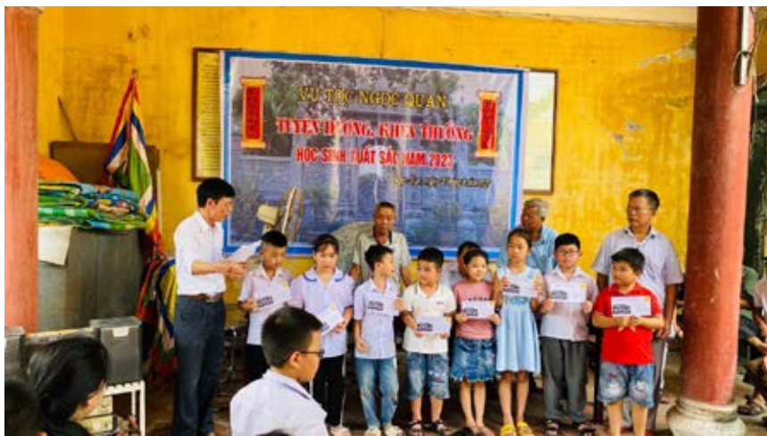
Vũ tộc Ngọc Quan tổ chức Lễ tuyên dương, khen thưởng các cháu học sinh tiêu biểu xuất sắc năm học 2023