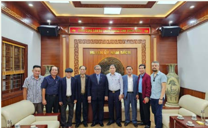
Lãnh đạo HDDH Vũ - Võ Việt Nam và tỉnh Hải Dương làm việc với Huyện ủy Nam Sách, về một số nội dung liên quan đến khu di tích Mộ cổ Đổng Dờm