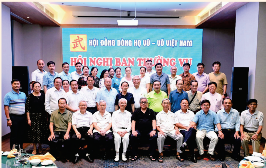
Ban Thường vụ HDDH Vũ - Võ Việt Nam họp tại Đồ Sơn - Hải Phòng (9/2023)