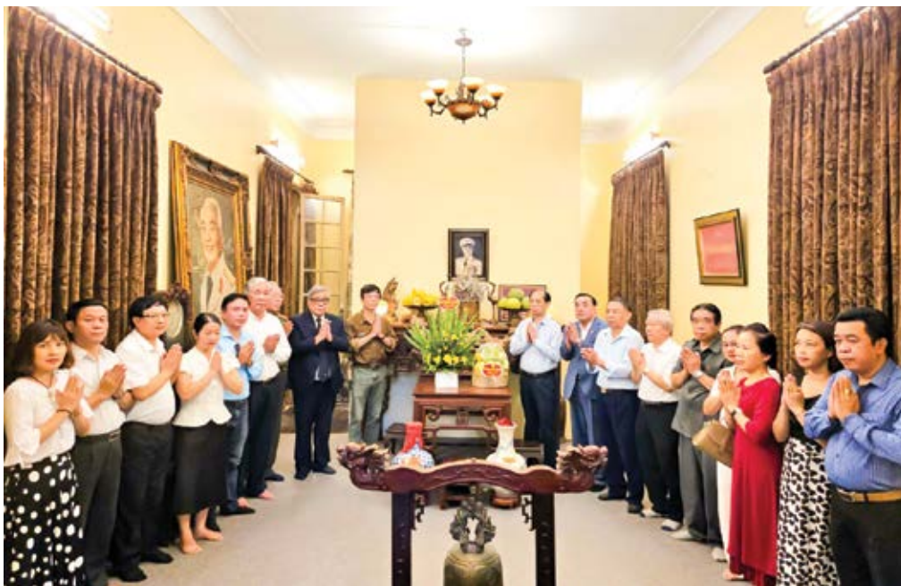
Đoàn đại biểu HDDH Vũ - Võ Việt Nam dâng hương tưởng nhớ Đại tướng Võ Nguyên Giáp

Vẫn biết sinh tử là lẽ tự nhiên, nhưng khi nghe tin Đại tướng từ trần, tôi thấy tim mình như nghẹn lại. Tôi chợt nhớ một câu không biết đã được đúc kết từ bao giờ, nhưng cứ truyền từ đời này sang đời khác: Sinh vi danh tướng, tử vi thần (có nghĩa là sống là danh tướng đánh giặc cứu nước, chết sẽ hóa thần). Trong lịch sử đã có những anh hùng dân tộc đã hóa thần trong lòng dân như Hai Bà Trưng, Lý Thường Kiệt, Trần Hưng Đạo, Trần Nhân Tông, Lê Lợi, Nguyễn Trãi, Quang Trung... Trong tận tâm khảm của mình, tôi nghĩ Đại tướng Võ Nguyên Giáp sẽ sống mãi và trở thành hình tượng thần thánh trong lòng dân.