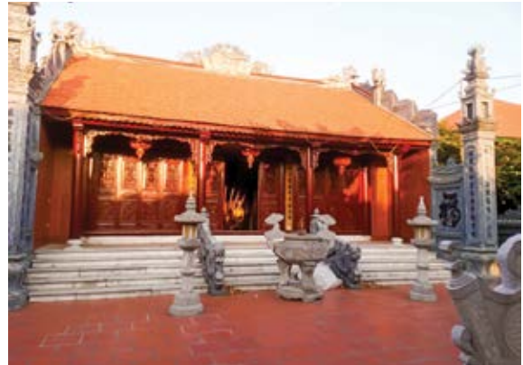
Nhà thờ quan Tri phủ Thiên Trường

Ông là người chăm chỉ, chịu thương chịu khó, thông minh, có chí lớn. Tuy là con quan huyện song cảnh nhà quan vẫn thanh bần, nhà lại đông các em, nên ông phải tạm ngừng học hành để làm ruộng giúp đỡ cha mẹ nuôi các em.