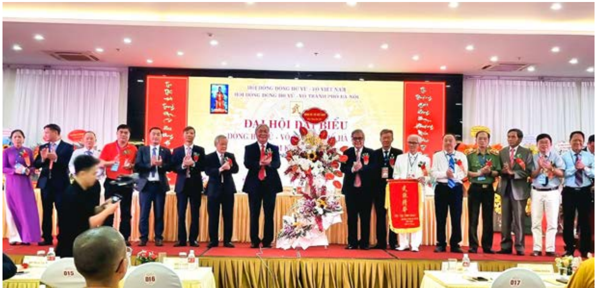
Lãnh đạo HDDH Vũ - Võ Việt Nam tặng hoa chúc mừng Đại hội