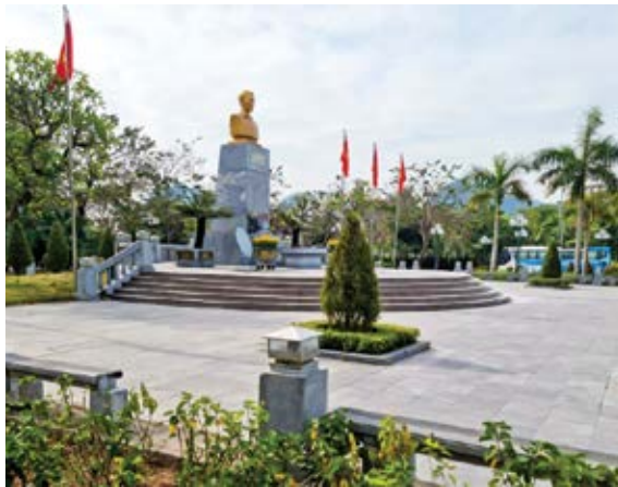
Tượng cụ Vũ Văn Hiếu dựng ở vị trí trang trọng, khuôn viên rộng 8.300m 2 trong công viên Lán Bè, phường Bạch Đằng, thành phố Hạ Long

Cuộc đời làm cách mạng của cụ Vũ Văn Hiếu vô cùng kiên trung bất khuất. Cụ sinh năm 1907 tại ấp Văn Định, xã Quần Phương Thượng, huyện Hải Hậu, tỉnh Nam Định. Vốn là người thông minh, năng động, Vũ Văn Hiếu đã sớm nhận ra sự bất công khi đất nước bị thực dân Pháp đô hộ. Khi trưởng thành, vào năm 1928, cụ đi lao động ở mỏ than thì gặp được các nhà cách mạng Nguyễn Văn Xứng (Lê Thanh Nghị), Nguyễn Khắc Khang (Lê Quốc Trọng), được truyền đạt tư tưởng cách mạng của lãnh tụ Nguyễn Ái Quốc, cụ càng hiểu thêm nỗi khổ của nhân dân, đất nước nô lệ và con đường đấu tranh giai cấp, giành độc lập cho dân tộc.