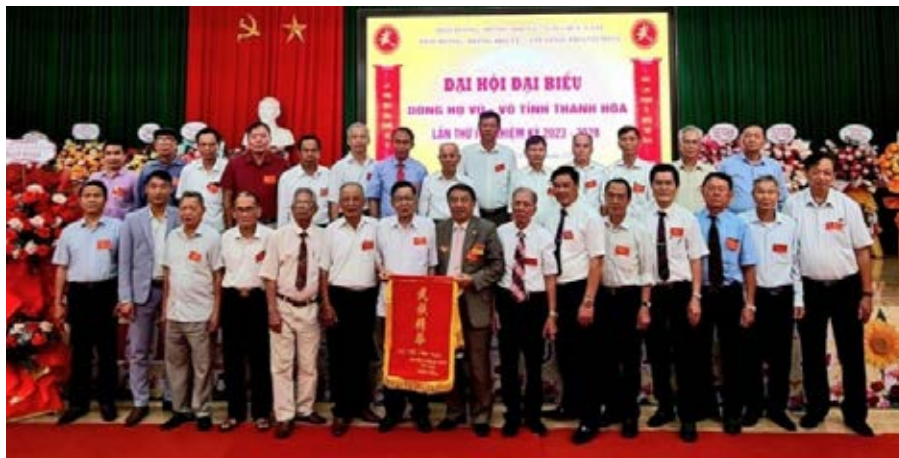
Ban Chấp hành dòng họ Vũ - Võ tỉnh Thanh Hóa nhiệm kỳ 2023 - 2028

Đại hội đã thành công trong niềm vui, niềm hân hoan phấn khởi, niềm hy vọng về sự hoạt động tích cực có trách nhiệm của các thành viên BCH dòng họ Vũ - Võ tỉnh Thanh Hóa nhiệm kỳ 2023-2028.