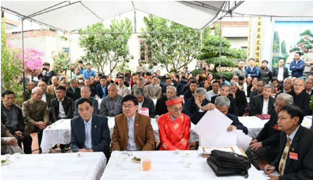
HDDH Vũ - Võ huyện Gia Bình tổ chức Hội nghị tổng kết hoạt động dòng họ năm 2023, phương hướng hoạt động năm 2024

Phó Chủ tịch TT HDDH Vũ - Võ huyện Gia Bình