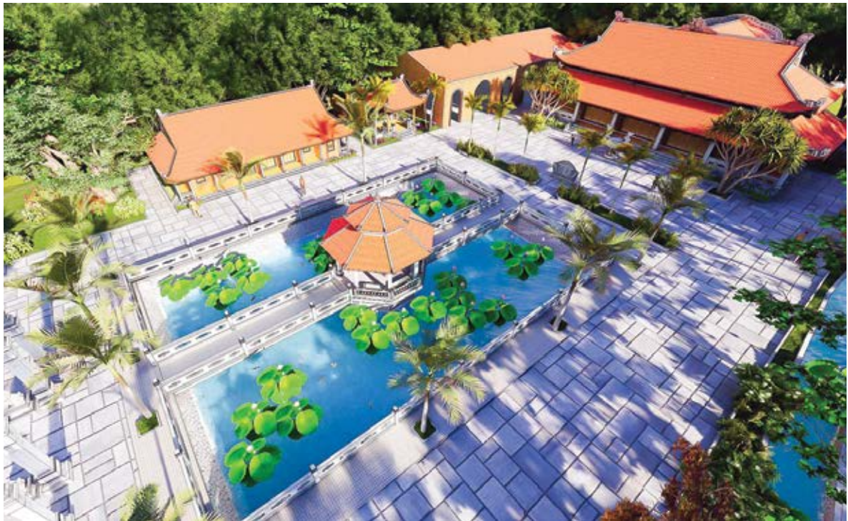
Khuôn viên từ đường dòng họ Vũ - Võ thành phố Hải Phòng

những người con Vũ - Võ Hải Phòng, đặc biệt là các ủy viên HĐDH, những doanh nhân Vũ - Võ Hải Phòng... Sự quyết tâm và đoàn kết được đặt lên hàng đầu trong mọi hành động, đó là sự thành công của Hội đồng dòng họ Vũ - Võ Hải Phòng ngày nay. Những sự quyết tâm ấy của Hội đồng dòng họ là điều không thể nghi ngờ, nhưng chắc hẳn để công trình sớm được hoàn thiện thì rất cần sự đóng góp, công đức của toàn thể các con cháu hậu duệ trong và ngoài nước, đó là những viên gạch, những nén hương thơm dâng lên tổ tiên và để lại cho thế hệ mai sau một công trình tâm linh đặc biệt quan trọng với niềm tự hào dòng họ Vũ - Võ Việt Nam “Nhân văn, văn hóa, đoàn kết, trí tuệ”.