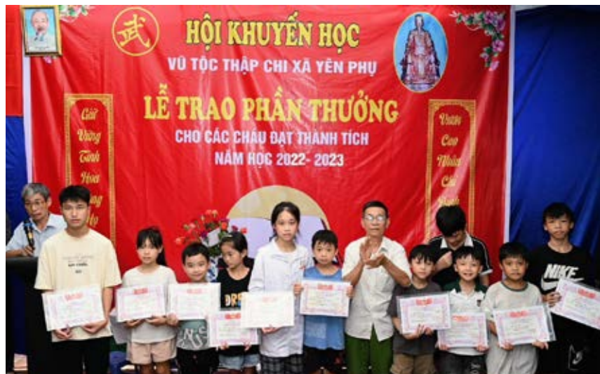
Trưởng ban Khuyến học, khuyến tài HĐDH Vũ - Võ huyện Yên Phong trao giấy khen cho các cháu học sinh

Quan tâm duy trì và đẩy mạnh công tác khuyến học, khuyến tài, phát động xây dựng quỹ khuyến học ở các chi dòng họ, hội nghị cũng đã ghi nhận và biểu dương Ban thi đua khuyến học khuyến tài của HĐDH Vũ - Võ huyện Yên Phong. Hội nghị cũng đã trao nhiều bằng khen, giấy khen của HĐDH Vũ - Võ Việt Nam, tỉnh Bắc Ninh và huyện Yên Phong cho các cháu học sinh, sinh viên giỏi, tiêu biểu xuất sắc năm 2023.