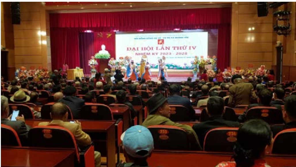
Toàn cảnh Đại hội dòng họ Vũ - Võ thị xã Quảng Yên lần thứ IV, nhiệm kỳ 2023 - 2028

Ngày 11/2/2023 tại Trung tâm tổ chức hội nghị UBND thị xã Quảng Yên, tỉnh Quảng Ninh, Hội đồng dòng họ Vũ - Võ thị xã Quảng Yên đã long trọng tổ chức đại hội lần thứ IV, nhiệm kỳ 2023-2028.