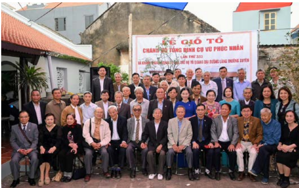
Các đại biểu chụp ảnh kỷ niệm