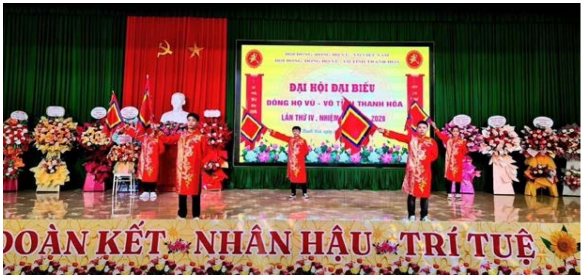
Tiết mục văn nghệ chào mừng Đại hội

Phó Chủ tịch HĐDH Vũ - Võ tỉnh Thanh Hóa