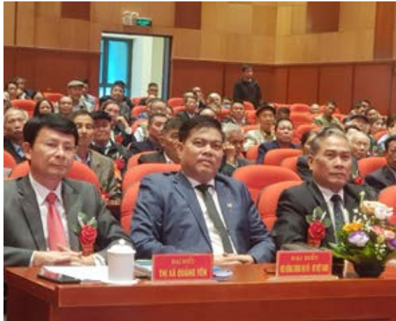
Đại biểu khách mời dự Đại hội

trình thành lập, kết quả hoạt động trên các phương diện xây dựng và phát triển của HĐDH thị xã nhiệm kỳ 2016 - 2022 và phương hướng, nhiệm vụ nhiệm kỳ 2023-2028.