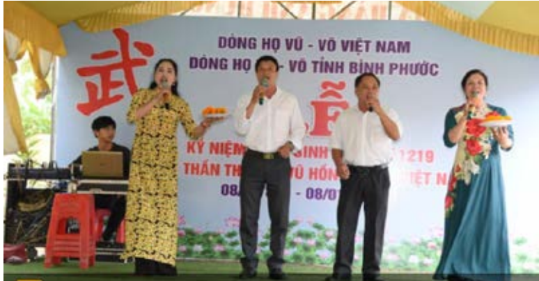
Đội Văn nghệ “Ba thế hệ” biểu diễn trong Lễ kỷ niệm lần thứ 1219 ngày sinh Thần tổ Vũ Hồn

Năm 2023 là năm thứ 4 thực hiện Nghị quyết Đại hội lần thứ II của Hội đồng Dòng họ Vũ - Võ tỉnh Bình Phước nhiệm kỳ 2019 - 2024. Hội đồng vẫn tiếp tục duy trì các hoạt động như thường lệ và đạt được những thành tựu nổi bật sau đây: