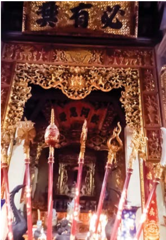
Ban thờ quan Tri phủ Thiên Trường