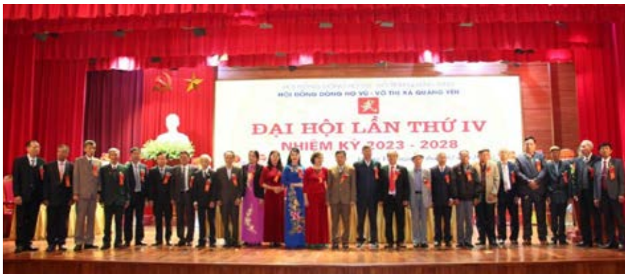
Ban Chấp hành Hội đồng dòng họ Vũ - Võ thị xã Quảng Yên khoá IV, nhiệm kỳ 2023 - 2028

thị xã Đông Triều và đại diện các dòng họ Bùi, họ Lê, họ Phạm, họ Dương, họ Hoàng trên địa bàn thị xã đã đến dự, chúc mừng góp phần vào thành công của Đại hội.