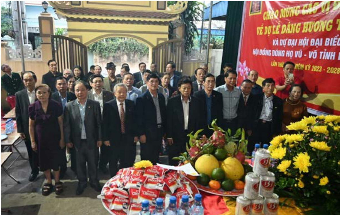
Các đại biểu về dự Đại hội dòng họ Vũ - Võ tỉnh Nam Định lần thứ III, nhiệm kỳ 2023-2028 dâng hương tại nhà thờ họ Vũ - Võ tỉnh Nam Định