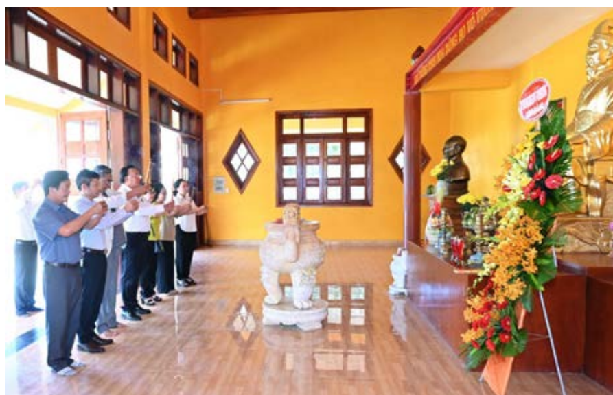
BCH, BTV HДДH Vũ - Võ tỉnh Bình Dương thắp hương tại nhà thờ họ