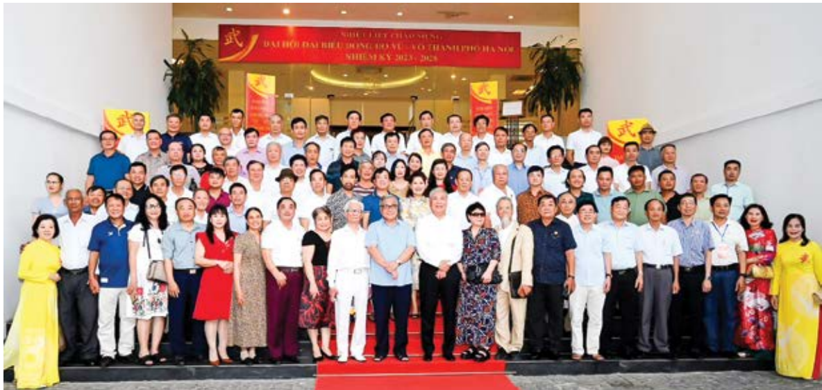
Các đại biểu dự Đại hội chụp ảnh kỷ niệm