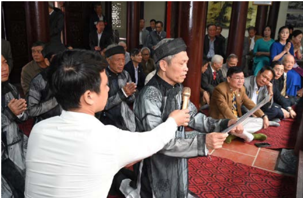
Các đại biểu làm lễ trong nhà thờ