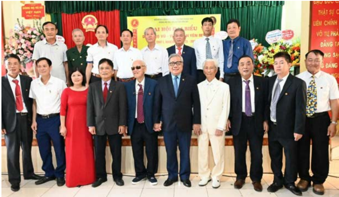
Lãnh đạo HĐDH Vũ - Võ Việt Nam và tỉnh Hưng Yên chụp ảnh kỷ niệm với BCH dòng họ Vũ - Võ huyện Yên Mỹ

N gày 29/10/2023, trên mảnh đất địa linh nhân kiệt giàu truyền thống văn hóa, dòng họ Vũ - Võ huyện Yên Mỹ, tỉnh Hưng Yên tổ chức Đại hội đại biểu lần thứ nhất, nhiệm kỳ 2023 - 2028.