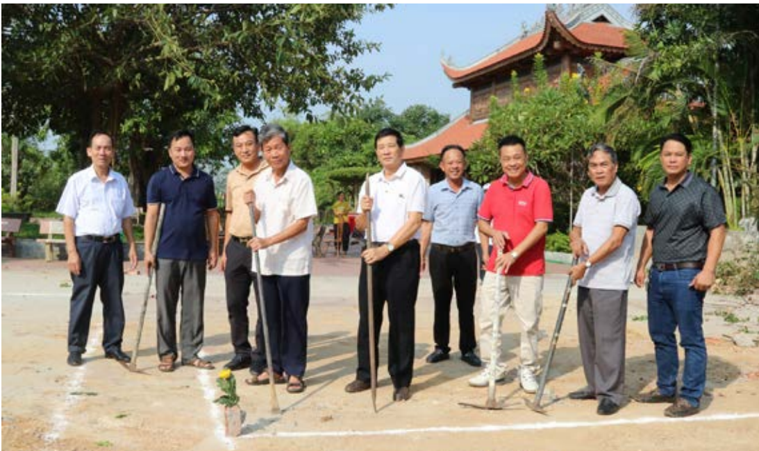
Khởi công xây dựng nhà Tả vu, Hữu vu