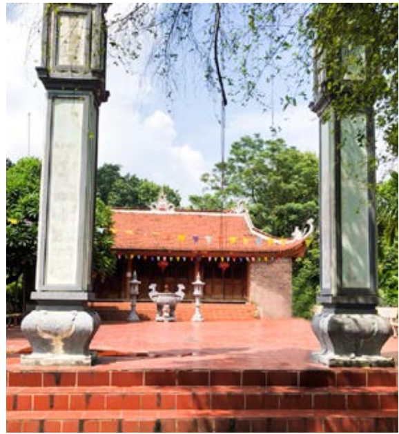
Di tích Thành nhà Bầu

Thành nhà Bầu là công trình phòng thủ quân sự do Vũ Văn Uyên và Vũ Văn Mật, (từng được vua Lê phong là Tổng