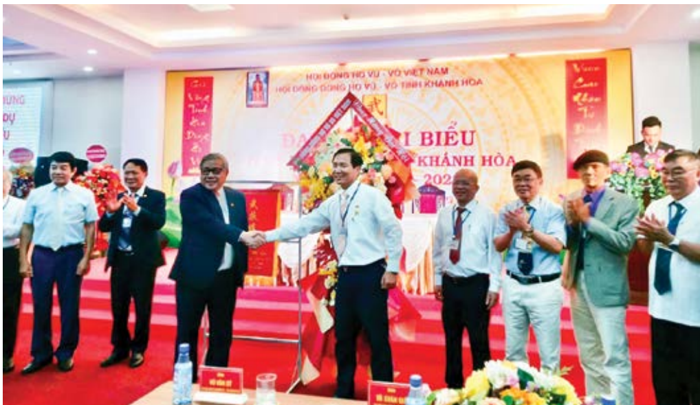
Lãnh đạo HDDH Vũ - Võ Việt Nam tặng hoa và bức trướng Vũ tộc tỉnh hoa cho Đại hội

N gày 24/9/2023 tại thành phố Nha Trang, Đại hội đại biểu dòng họ Vũ - Võ tỉnh Khánh Hòa đã tổ chức thành công tốt đẹp. Đại hội phần khởi được đón tiếp GS.TSKH.NGND Vũ Minh Giang - Chủ tịch HDDH Vũ - Võ Việt Nam đến dự và chỉ đạo Đại hội. Cùng đi có các ông trong Thường trực, Ban Thường vụ HDDH Vũ - Võ Việt Nam, đến dự còn có hơn 20 đoàn đại biểu HDDH Vũ - Võ các tỉnh, thành phố trong cả nước, các họ bạn trong tỉnh và hơn 200 đại biểu đại diện các chi dòng họ trong toàn tỉnh.