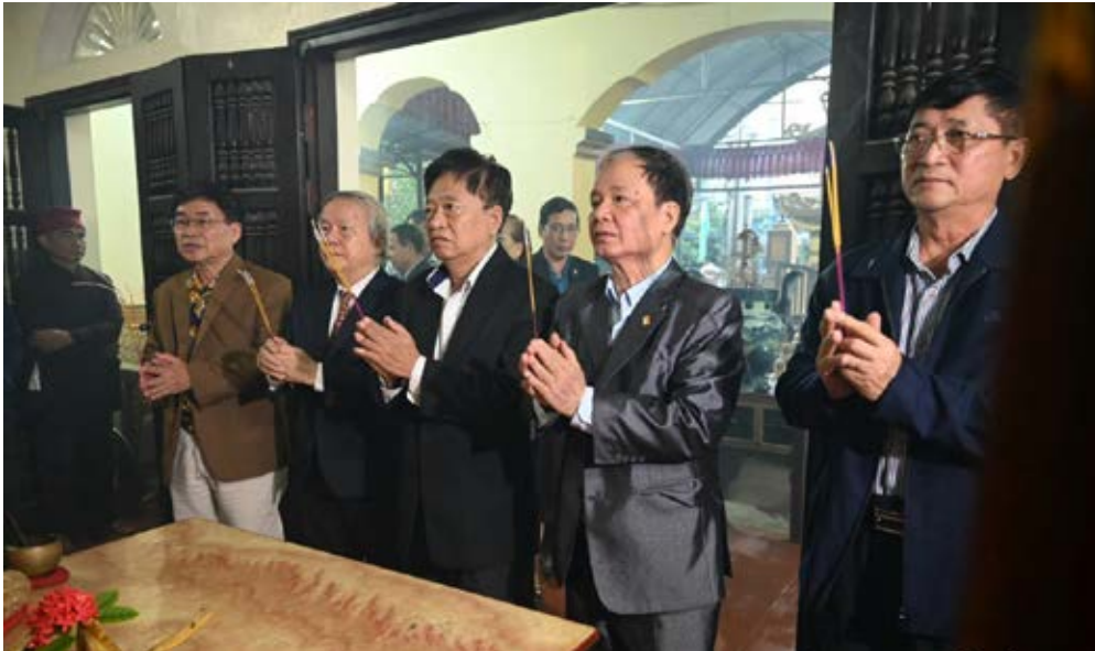
Các đại biểu dâng hương tại nhà thờ họ Vũ - Võ tỉnh Nam Định

Có thể nói Hội đồng dòng họ Vũ - Võ tỉnh Nam Định 30 năm qua luôn kiên trì, cố gắng, vượt qua mọi khó khăn thử thách, góp phần tích cực xây dựng dòng họ ngày càng phát triển bền vững.