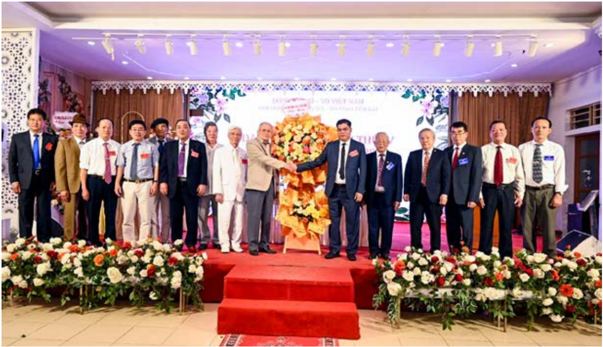
Lãnh đạo HDDH Vũ - Võ Việt Nam tặng hoa chúc mừng Đại hội