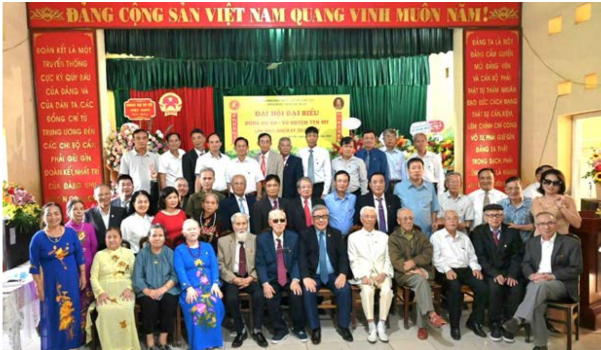
Các đại biểu chụp ảnh lưu niệm với BCH HĐDDH Vũ - Võ huyện Yên Mỹ, nhiệm kỳ 2023 - 2028

Đại hội cảm ơn tấm lòng vàng của các tổ chức, cá nhân đã ủng hộ công sức và tiền của cho hoạt động của dòng họ.