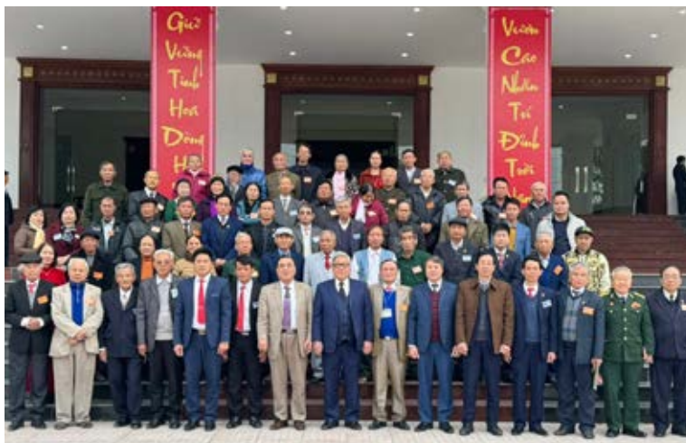
Lãnh đạo HĐDH Vũ - Võ Việt Nam chụp ảnh kỷ niệm với các đại biểu dự Đại hội