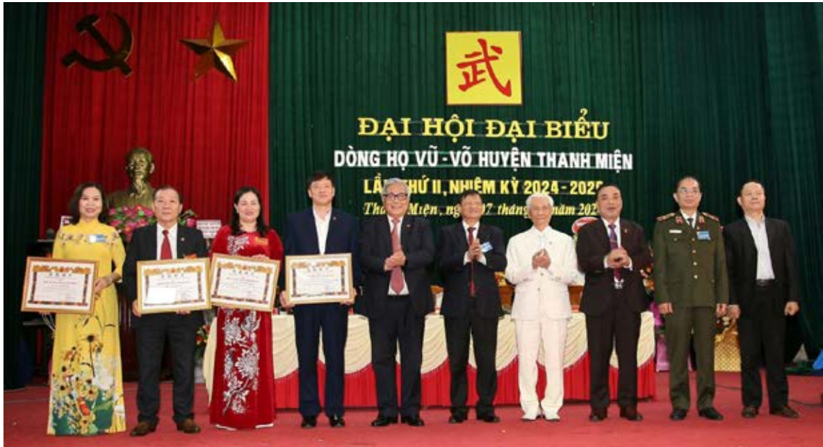
Lãnh đạo HĐDH Vũ - Võ Việt Nam và tỉnh Hải Dương trao bằng Vũ tộc tinh hoa cho các tập thể và cá nhân

đạo Huyện ủy, UBND, Ủy ban Mặt trận Tổ quốc Việt Nam huyện Thanh Miện, các vị đại biểu Thường trực dòng họ Vũ - Võ các huyện, thị xã trong và ngoài tỉnh Hải Dương (HĐDH Vũ - Võ huyện Phù Cừ - Hưng Yên, Quỳnh Phụ - Thái Bình), phóng viên báo chí, đại phát thanh huyện, đại diện các dòng họ trong huyện: Trần, Bùi, Lê, Ban quản lý di tích lịch sử Mộ Trạch, Đống Dòm, Kiệt Đặc, các vị chức sắc của một số cơ sở tôn giáo, con em quê hương, hậu duệ của dòng họ Vũ - Võ đang công tác, lao động trong cả nước. Đặc biệt là sự có mặt của 167 đại biểu ưu tú được bầu, chọn từ 12 tổ chức dòng họ cơ sở đại diện cho hơn 1.200 hội viên trong toàn huyện.