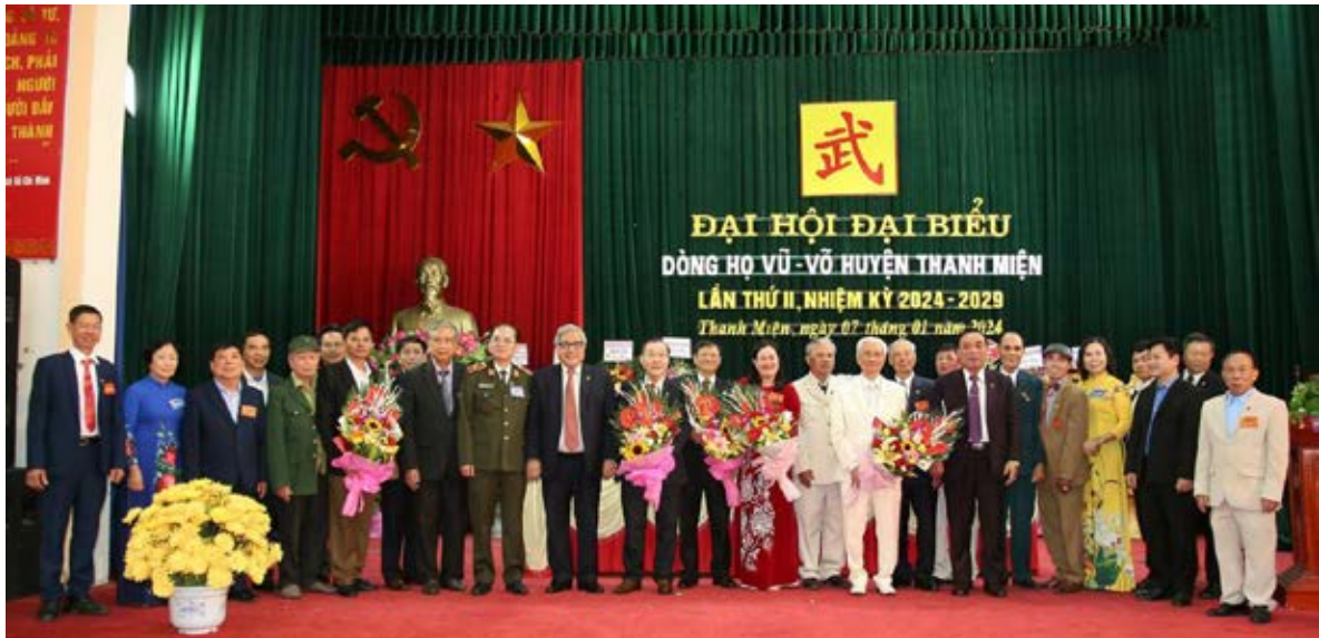
Lãnh đạo HDDH Vũ - Võ Việt Nam và HDDH Vũ - Võ tỉnh Hải Dương tặng hoa BCH dòng họ Vũ - Võ huyện Thanh Miện, nhiệm kỳ 2024 - 2029