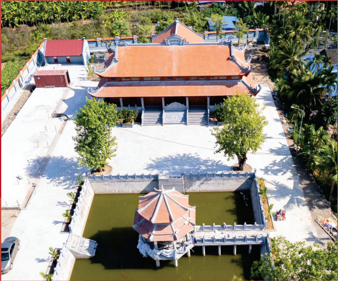
Từ đường dòng họ Vũ - Võ thành phố Hải Phòng