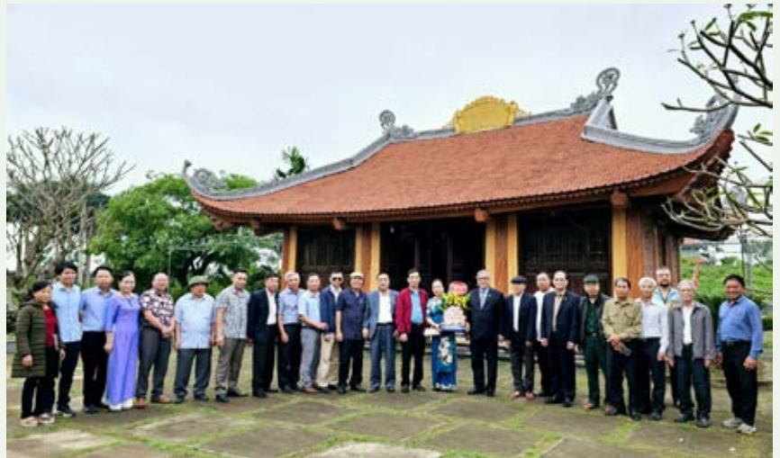
Lãnh đạo HDDH Vũ - Võ Việt Nam và Hải Dương tổ chức dâng hương và làm việc với Ban Quản lý khu Mộ cổ Đổng Dờm, Nam Sách, Hải Dương