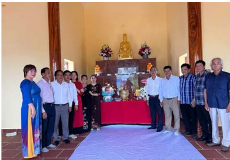
Đại diện Ban Chấp hành dòng họ Vũ - Võ tỉnh Cà Mau dâng hương Đức Thần tổ